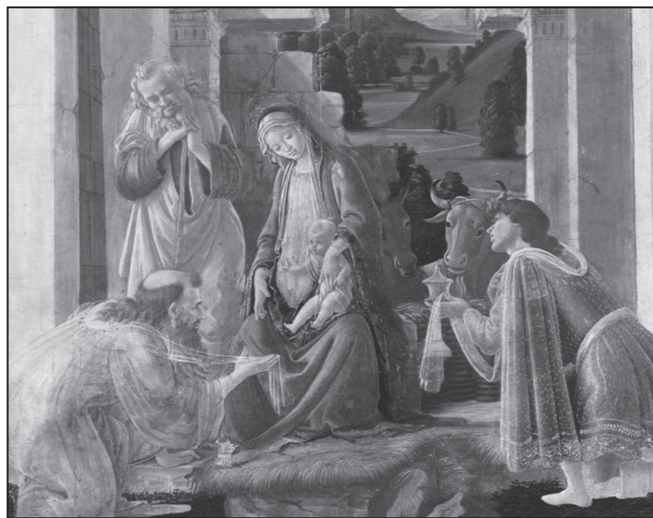
Sandro Botticelli – Királyok imádása (részlet, kb. 1478–82. National Gallery of Art – Washington)

Megvásárlásával iskolánk alapítványát támogatja.