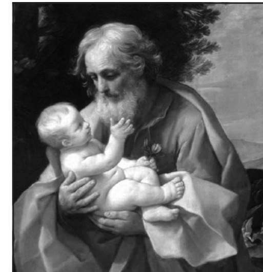
Guido Reni – Szent József a gyermek Jézussal (részlet - kb. 1620.), Hermitage, Szentpétervár

A magunk rész szerint való, töredékes emberi mértéke szerint csak igen kevesen vannak, akik képesek túllátni saját „pillanatnyi” életük határain. Azt talán még el tudjuk fogadni, hogy éltek a nagyapáink, nagyanyáink, hiszen ismertük őket, de csak úgy tudunk gondolni rájuk, mintha mindig is öregek lettek volna. Az előttük lévő generációk pedig a távoli, ködös múltba vesznek bele. Mintha csak velünk kezdődött volna a világ. Pedig ők is megszülettek. Voltak gyermekek, fiatalok, vágyakat kergető és megvalósító felnőttek, majd elfogyatkozó idősök. Belőlük nőtt ki a mi életünk. Nekik is volt Adventjük, Karácsonyuk. Ők is várták, visszavárták Jézus Krisztust.